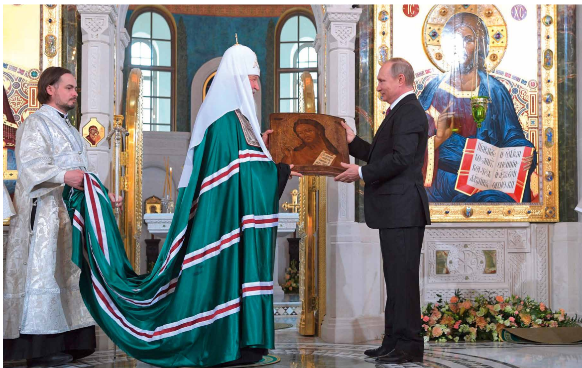
Der Zar und sein Hofprediger: Wladimir Putin mit dem Moskauer Patriarchen Kyrill I. (2017)

P utins Traum von der russisch-orthodoxen Großmacht wirkt merkwürdig aus der Zeit gefallen – und doch hat sein Wahnsinn System: Mithilfe alter KGB-Verbindungen ist es dem russischen Despoten nicht bloß gelungen, die Opposition im eigenen Land kaltzustellen, sondern nahezu alle Demokratien der Welt zu destabilisieren. Putins Leute konnten dabei auf erprobte Mittel aus dem Kalten Krieg zurückgreifen: So wie der KGB einst Linksterroristen wie die RAF mit verdeckten Operationen unterstützt hatte, griff der russische Geheimdienst nun Rechtspopulisten unter die Arme.