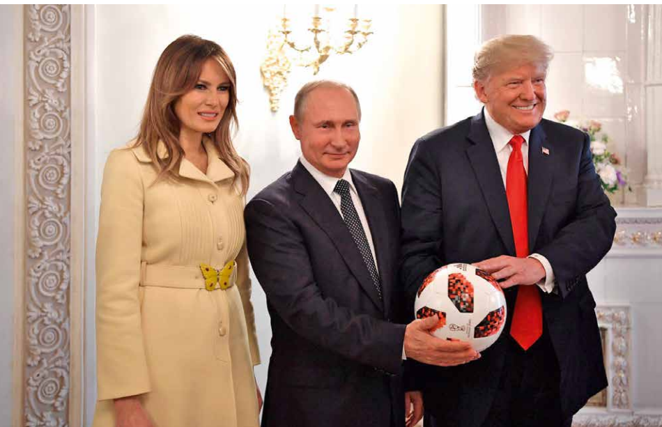
Der Wunsch-Präsident des Kremls: Wladimir Putin mit Donald Trump und Ehefrau Melania (2018)

Putins Leute förderten den Brexit in England und die Wahl Trumps in den USA, sie finanzierten Marine Le Pen in Frankreich und Viktor Orbán in Ungarn. Beträchtliche Geldströme flossen in internationale Pro-Life-, Anti-Gay- und Anti-Gender-Initiativen sowie in Troll-Fabriken, die über das Internet wahnwitzigste Verschwörungstheorien verbreiteten. Die britische Journalistin Catherine Belton stellte in ihrem gründlich recherchierten Buch „Putins Netz“ sogar die These auf, dass das russische Flächenbombardement in Syrien u.a. aus dem Kalkül erfolgte, die europäischen Länder durch die gezielte Produktion von Kriegsflüchtlingen unter Druck zu setzen und den Hass der Bürgerinnen und Bürger auf das politische Establishment anzuheizen.