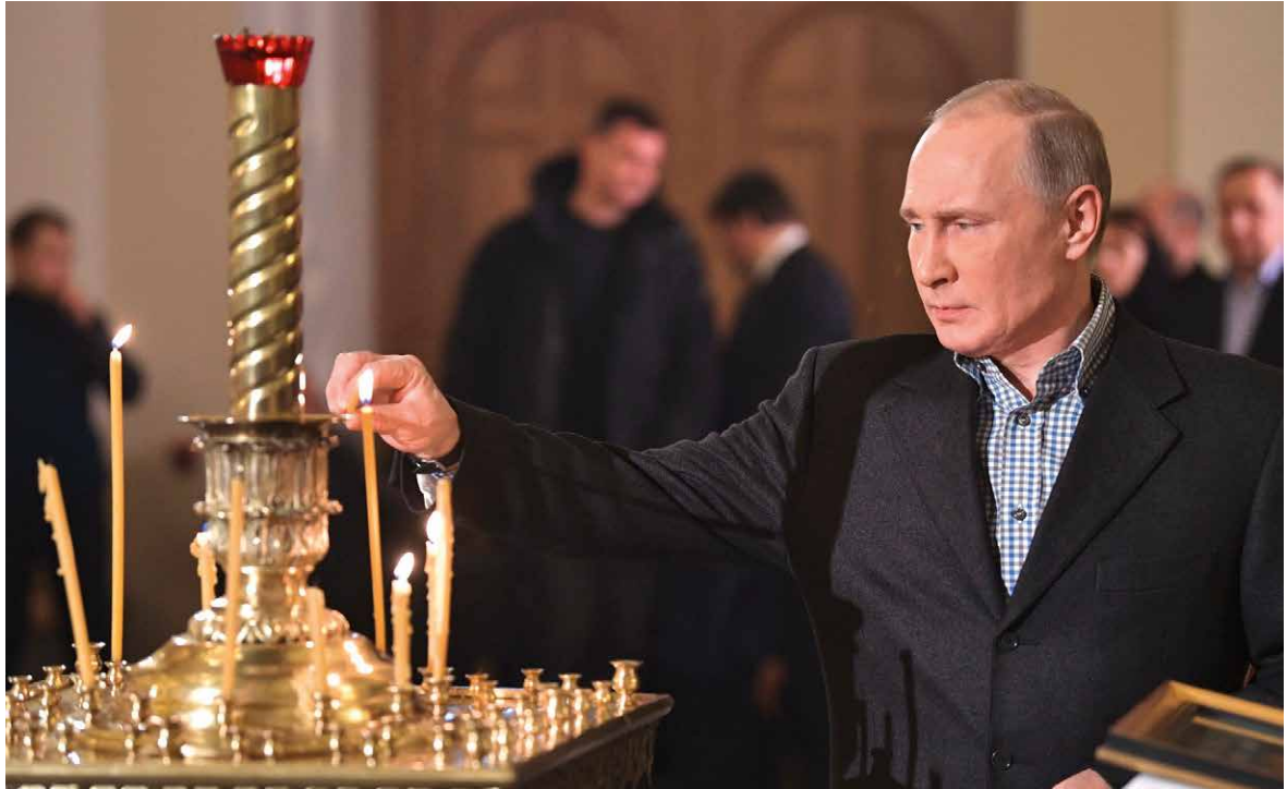
Wladimir Putin bei der Weihnachtsmesse in St. Petersburg (2017)

Das Erstaunlichste am russischen Einmarsch in die Ukraine war das Erstaunen westlicher Politiker*innen über diesen Einmarsch. Offenbar haben sie bis zum Schluss verdrängt, wie gezielt Wladimir Putin die Grundlagen für die Eskalation geschaffen hat. Denn der Krieg war von langer Hand vorbereitet – nicht nur auf ökonomischer und militärischer, sondern auch auf soziokultureller Ebene: In den letzten 20 Jahren wurden die russischen Bürgerinnen und Bürger systematisch auf eine „russisch-orthodoxe Identität“ zugerichtet, auf deren Basis erst jene „gruppenbezogene Menschenfeindlichkeit“ entstehen konnte, die sich im Krieg gegen die Ukraine entlud.