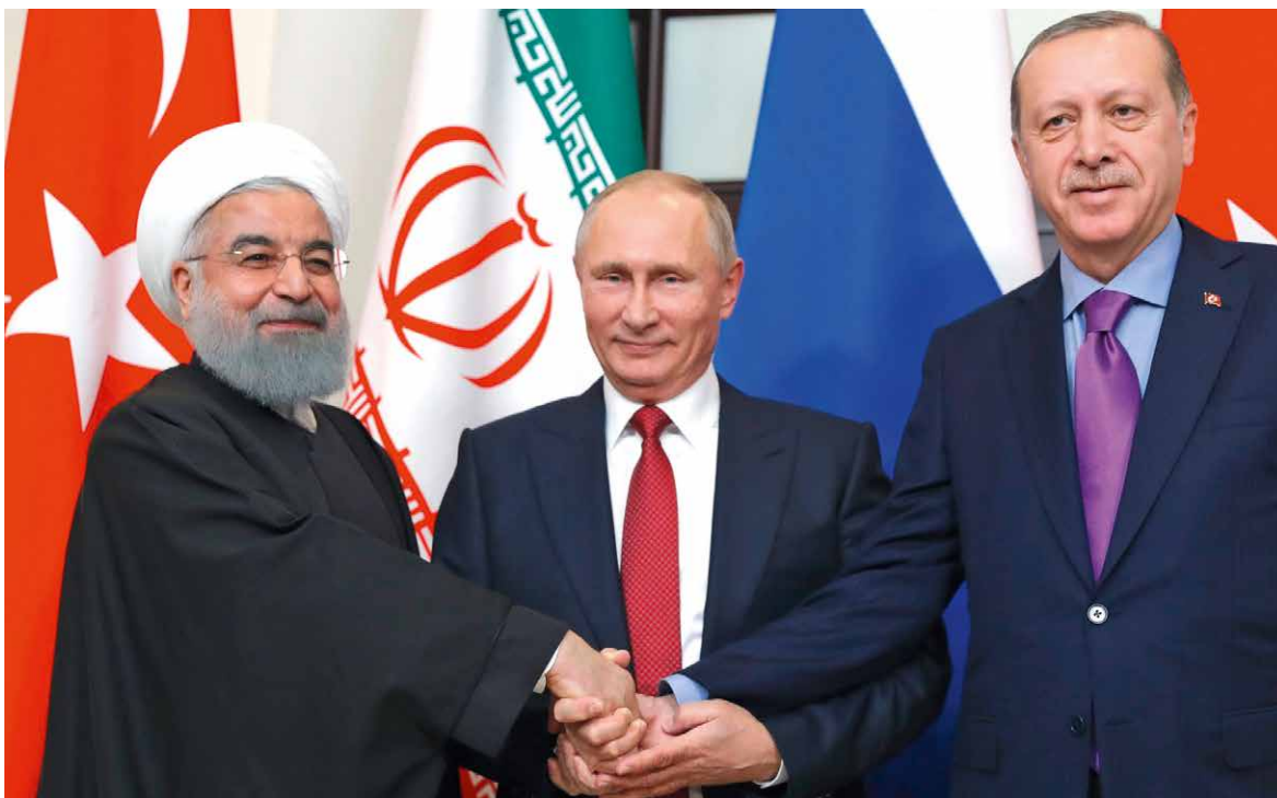
Die „Internationale der Nationalisten“ im Kampf gegen die offene Gesellschaft: Der iranische Präsident Hassan Rohani mit Wladimir Putin und Recep Tayyip Erdoğan (2017)

politische Auffangbecken für diejenigen, die mit den beschleunigten Veränderungszyklen der globalisierten Welt nicht Schritt halten können und alles daran setzen, ihr angestammtes kulturelles Getto gegen das vermeintlich „Feindliche“ des „Fremden“ zu verteidigen.