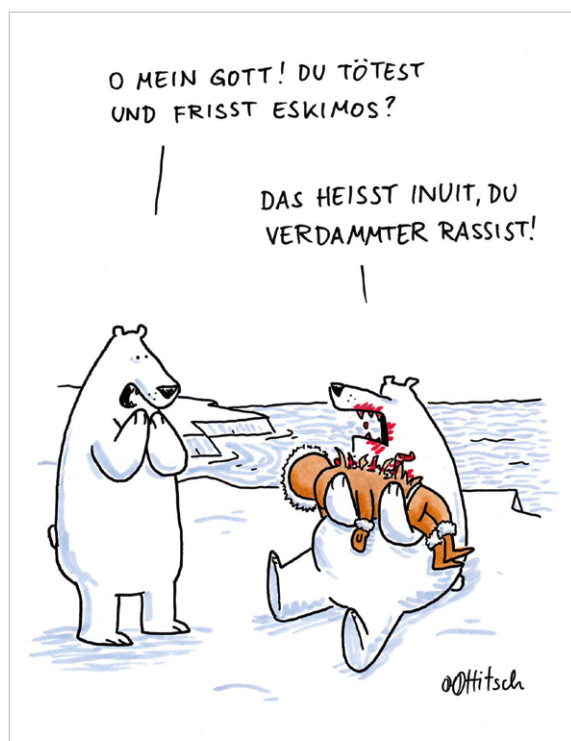
Falsche Prioritäten: Identitäre Linke neigen dazu, die eigentliche Bedrohung der offenen Gesellschaft zu übersehen

Für die Verteidigung der offenen Gesellschaft wäre viel gewonnen, wenn „identitäre Linke“ die logischen Widersprüche erkennen würden, in die sie sich mit ihrer postmodernistischen Argumentation zwangsläufig verstricken. Um hier nur zwei Punkte zu nennen, die Pluckrose und Lindsay in ihrer Studie mit zahlreichen Beispielen unterfüttern: Es ist keineswegs „eurozentristisch“, für die Universalität der Menschenrechte einzutreten – eurozentristisch wäre es vielmehr zu behaupten, dass die Menschenrechte eine exklusive Errungenschaft des Westens seien, an denen Menschen anderer Kontinente und Kulturen nicht mitgewirkt hätten. Gleichfalls ist es natürlich keineswegs „rassistisch“ (Ausdruck der „Ideologie des alten, weißen Mannes“), auf der Einhaltung solider wissenschaftlicher Standards und der Berücksichtigung empirischer Forschungsergebnisse zu bestehen – rassistisch wäre es vielmehr zu glauben, dass Menschen anderer Kontinente und Kulturen nicht in der Lage seien, solide wissenschaftliche Forschung zu betreiben.